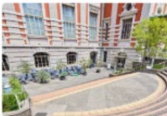
大阪市中央公会堂 南側 サンクンガーデン

※受付は大会議室で行います。 建物の南側のサンクンガーデンの階段を下りた、地下1階の左手にある「西入口」(図中①)からお入りください。