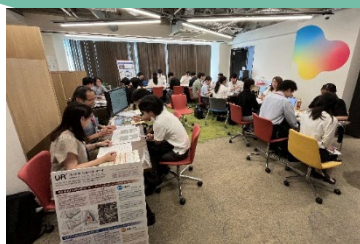
▲昨年度の説明会の様子