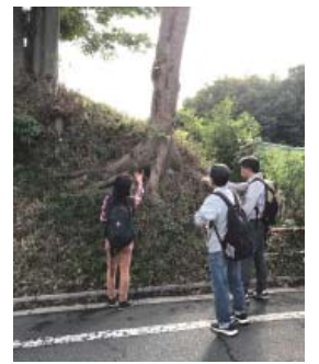
普段は通り過ぎるだけの道で、 樹木に目を向ける