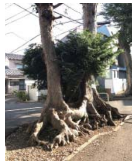
木の筒から木が生えている！ 面白いみどりを発見