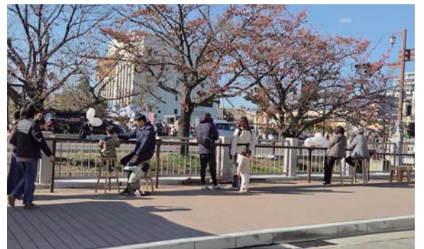
公共空間での過ごし方・使い方をもっと豊かに

今回の社会実験では、緑地空間に椅子やパラソルなどのフアニチャアを配置することで、来訪者が、心地よく滞在できるような仕掛けをするとともに、沿道のカフェ利用者がテイクアウトしたコーヒーなどを「もといば」で楽しむ