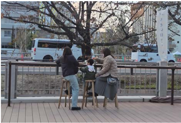
椅子があると人が溜まり会話が生まれます

11月18日〜12月3日の期間、大阪府茨木市の元茨木川緑地において、「もといばテラス」という社会実験を行いました。