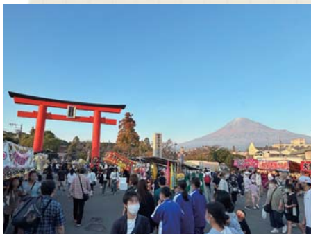
赤く染まる富士と富士山本宮浅間大社

あたりは、夜店に喜ぶ子どもたちの温かいざわめきに満たされていますが、夕暮れの淡いグラデーションの空に魅入られると、ざわめきは波が引くように消えていきました。見渡すと、赤い鳥居、大社と森、ずっと遠くに見える富士山があります。富士山も夕暮れの色になじんでいるものの、それでいて力強い確かな存在感を放っています。境内が、何か美しいものに満たされた、小さな世界として完結してしまったように思えました。時が止まるというよりは、時間の概念に刻まれる以前の世界のような。そのように感じられたのは、世界の中心のような存在を持つ富士山が、そこにあったからではないかと思えます。富士山に抱かれた街での、マジックアワーでした。