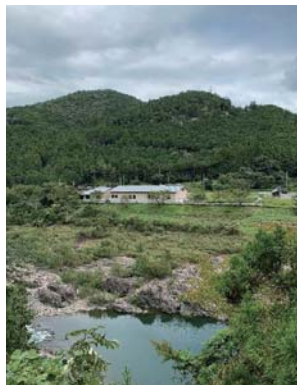
北山川と新じゃばら加工場全景

じゃばらは柑橘系の木で北山村が原産地とされています。江戸時代から庭先に植えられて、北山村では正月料理のさんま寿司や昆布巻に絞汁を酢の代わりに使っていたそうです。1970年代、じゃばら栽培農家の訴えで村に残ったたった一本のじゃばらの原木を、柑橘類の分類で有名な田中諭一郎博士に調