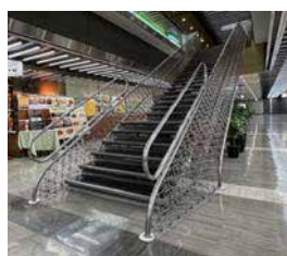
パレスサイドビル (設計：林昌二) 内の「夢の階段」

建築めぐりをしていると階段の美しさにハッとすることがあります。職人技が光る重厚な彫り物の親柱や手すり、フィボナッチ整列が潜んでいる螺旋階段などなど。時にはエントランス空間を支配するその存在感に圧倒されます。階段は上り下りする目的で作られたものですが、観方によると芸術作品でもあります。