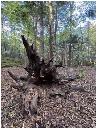
根こそぎ倒れた木 すぐ向こうに見えるのが岩むす樹海