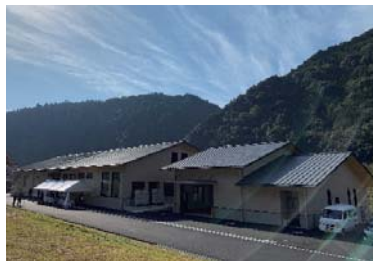
新じゃばら加工場全景

たった1本の自生のじゃばらの木から始まった北山村の村づくりの取組が、大きな加工施設の完成により新たなステップに向かって昇ろうとしています。この施設が、次代を担う若者たちと一緒にその目的を果たしていくことを切に願っています。