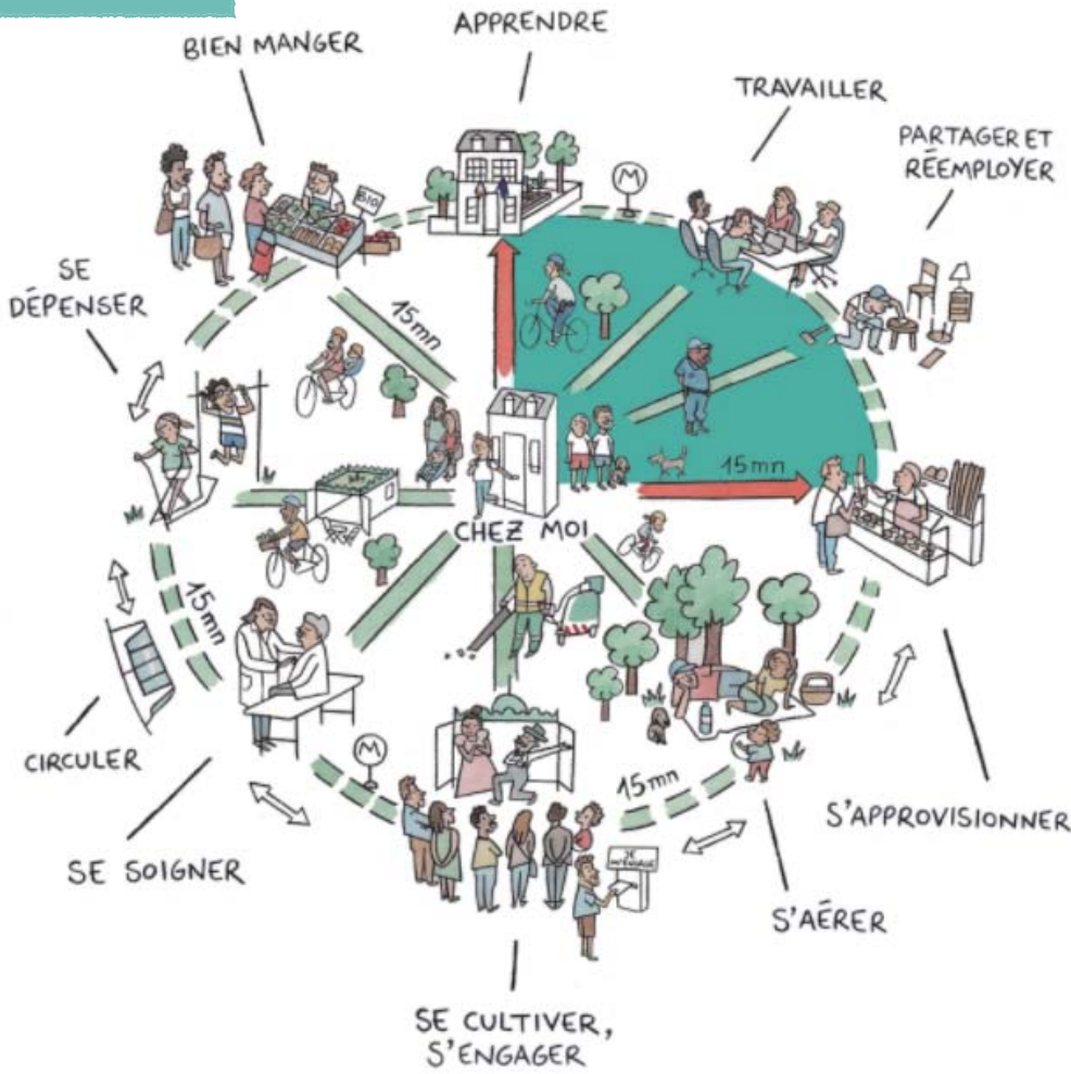
【写真:15-minute city, Paris en Commun】