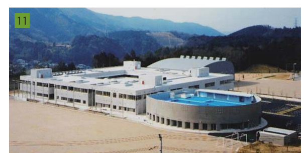
11 箕面市止々呂美地域の新都市「箕面森町」の新たな地域のシンボルとして小中一貫校を設計した。新たな義務教育のあり方を研究しながら、検討を進めた。