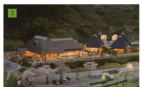
3 自立的地域経営の考え方をもって、各地の温浴、地域振興施設を多数手がける。写真は奈良県下北山村の元気・本気の村づくりの拠点。設計・監理、運営立上げのサポートを行った。