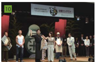
10 伊勢「外宮さんにちなんだどんぶりコンテスト」