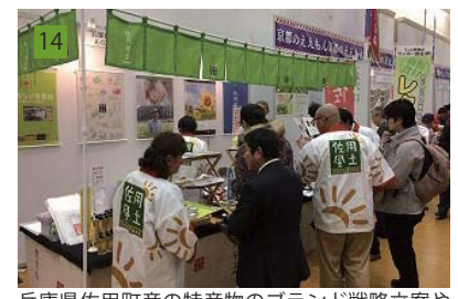
14 兵庫県佐用町産の特産物のブランド戦略立案や事業者の研修を実施。展示商談会やマルシェ出展、ECサイト構築も支援。