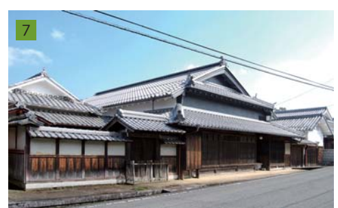
7 丹波篠山市にて伝建地区指定に向けた調査を実施以来、伝統的建造物修理の設計監理及び地区のまちづくりを継続してサポートすると共に、他地域（福住、出石、大杉、龍野）の伝建地区指定も手がける。その後も各地で歴史的建造物を活用したまちづくりに取り組む。