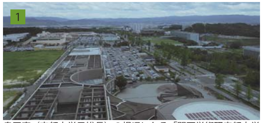
奥田東（京都大学元総長）の提唱になる「関西学術研究都市学研都市」の事務局として構想の提言と推進をお手伝いした学研都市が10年を迎える。