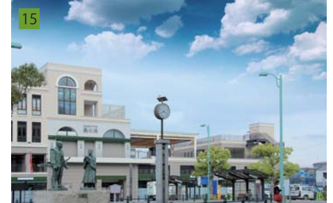
15 都市計画決定から約3年間に渡り、駅前の賑わいの拠点となる「えきまちテラス長浜」の事業推進・設計・運営管理を担当した。