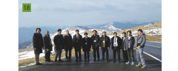
18 ひょうご持続可能地域づくり機構（HsO）：持続可能な地域づくりを牽引する人材育成プログラムを実施中。高校生～60代までの多様な世代・業種100名以上が受講。