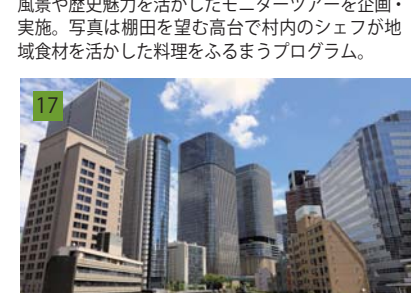
17 導入の経緯から様々な位置づけのあった景観施策を再編し、地域まちづくりと連携の仕組みを組み込んだ景観計画に改定。