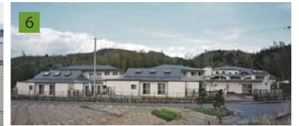
6 創業時より保育施設を始め、障がい福祉・教育施設を多数設計している。写真は京都府内の知的障がい者入所更生施設。分棟型の施設配置とし、建物の外と内の係わりを大切にしながら全体が1つの「まち」となるよう計画した。