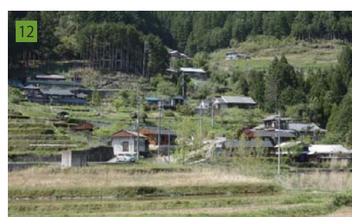
12 平成23年8月の紀伊半島第3水害、平成28年4月の熊本地震。地域の方々の復興に向けた様々なお願いを込めた地域づくりをサポート。