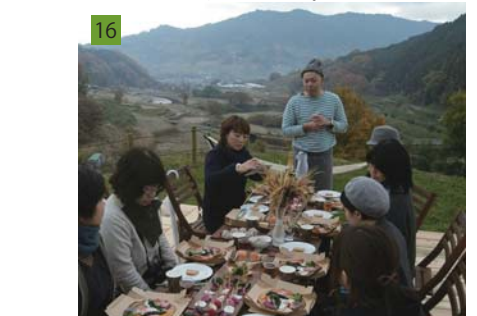
16 風景や歴史魅力を活かしたモニターツアーを企画・実施。写真は棚田を望む高台で村内のシェフが地域食材を活かした料理をふるまうプログラム。