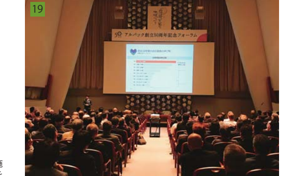
19 創立50周年記念フォーラム