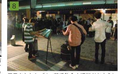
8 伊丹まちなかパル：若手飲食店経営者を中心に実行委員会方式で開催した「まちなかイベント」。その後、多様な主体の連携による伊丹郷町のまち育てに展開していった。