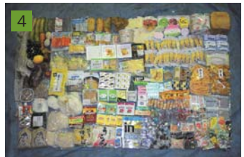
40年にわたり、ごみ排出構造の調査分析を行っている。容り法を初めとした個別リサイクル法制定の基礎資料等に活用されてきた。