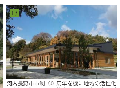
13 河内長野市市制60周年を機に地域の活性化と交流の拠点として整備された。奥河内ビジターセンターと地産地消レストランで構成され、運営事業者と協力しながら設計を進めた。